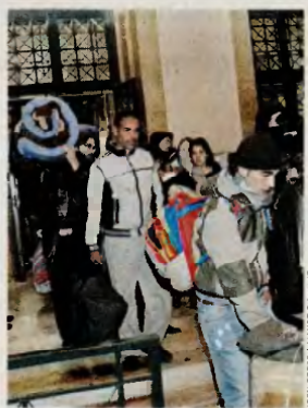
Οι τρεις οιονεί κατηγορούμενοι καλούνται να δώσουν εξηγήσεις στον εισαγγελέα Εφετών.