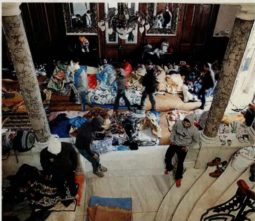
Ψήφισμα συμπαράστασης υπέρ των μεταναστών προτάθηκε κατά τη διάρκεια της χθεσινής συνεδρίασης του δημοτικού συμβουλίου του Δήμου Αθηναίων.